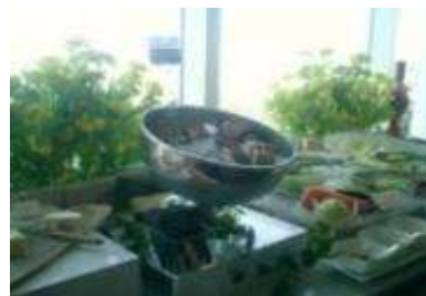
朝食ビュッフェライン 試供品設置