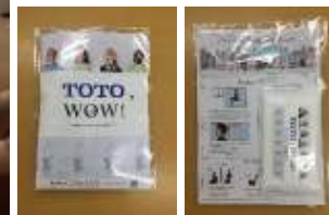
ビジネスホテル 東京・大阪 4施設