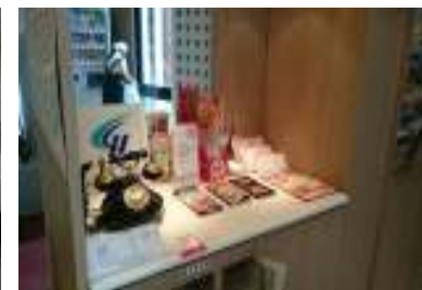
レジ周辺 印刷物設置