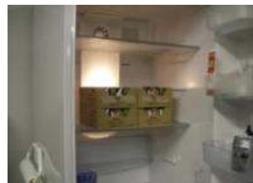
試供品部屋置き設置（冷蔵）