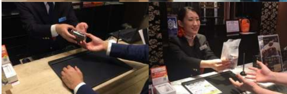
アパホテル系列 <ビジネスホテル>