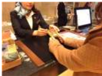
チェックインカウンター 手渡しサンプリング