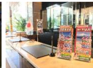
レジフロント設置サンプリング