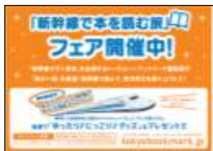
J R 東海様 「新幹線で本を読む旅」フェア