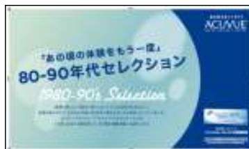
ジョンソン・エンド・ジョンソン様 「80-90年代セレクション」フェア