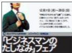
花王様 サクセス 「ビジネスマンのたしなみ」フェア