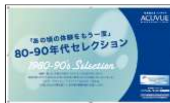
ジョンソン・エンド・ジョンソン様 「80-90年代セレクション」フェア