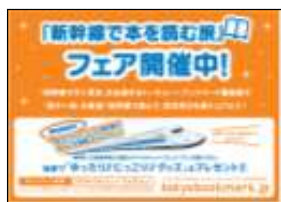
J R東海様 「新幹線で本を読む旅」フェア