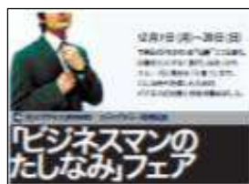
花王様 サクセス 「ビジネスマンのたしなみ」フェア